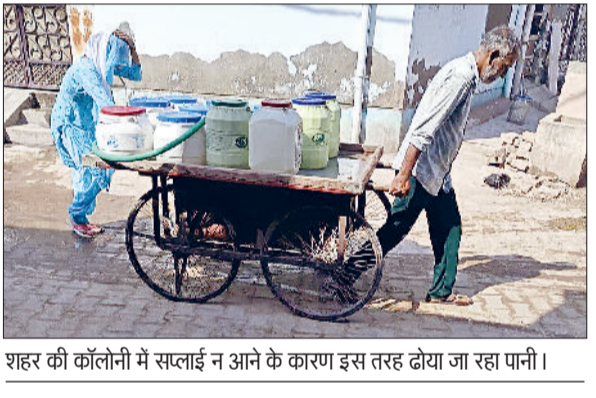
शहर की कॉलोनी में सप्लाई न आने के कारण इस तरह ढोया जा रहा पानी।

प्रभावित क्षेत्रों में टैंकर भेजे जा रहे हैं और जरूरत पड़ने पर लोग फोन करके भी निशुल्क टैंकर की बुकिंग भी कर सकते हैं। हालांकि टैंकरों की संख्या सीमित होने के कारण सभी कॉलोनियों तक समय पर पहुंचना संभव नहीं हो पा रहा। फिर भी लोगों की जरूरतों को पूरा किया जा रहा है। आमजन को पानी के लिए परेशान नहीं होने दिया जा रहा है।