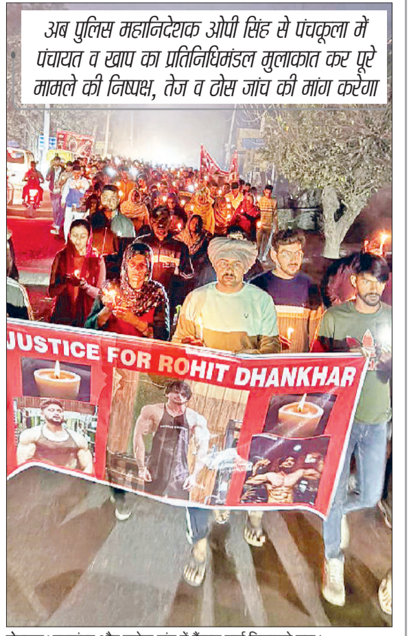
रोहतक। हुमायूँपुर और बखेता गांव में कैडल मार्च निकालते युवा।