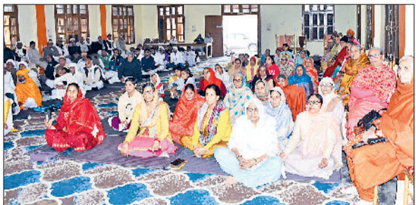
रोहताक। दयानन्द मठ में आयोजित वैदिक मासिक सत्संग में प्रवचन सुनते आर्य समाजी।

में अच्छे कर्म करके हमें उन्नति की ओर अग्रसर होना चाहिए। आज समाज में वेदप्रचार की अधिक आवश्यकता है। उन्होंने इस बारे में अनेक दृष्टान्त भी दिये तथा बताया कि अब हमें भी इस ओर अधिक ध्यान देने की जरूरत है एवं इस मार्ग पर छोटे बच्चे, युवा तथा बुजुर्ग सभी मिलकर साथ चलना होगा। आज के मुख्यवक्ता के रूप में वैदिक विद्वान आचार्य वेदमित्र का मासिक वैदिक सत्संग में पहुंचने पर